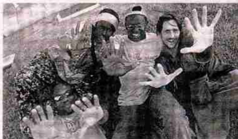
Varios de los miembros de Livika, en la sede de Diario de Ibiza