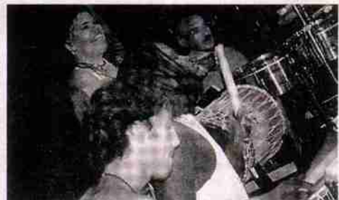
Un momento de la actuación de los percusionistas el pasado día 1 de julio