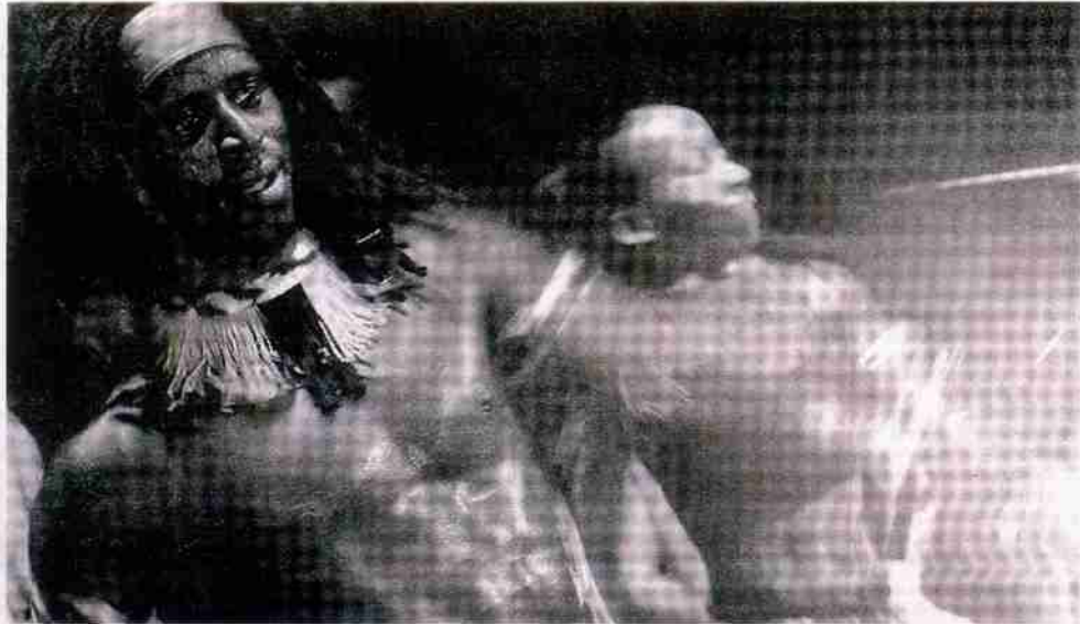
Un bailarín acompañará a los percusionistas de Livika durante su actuación de esta noche en la Namasté de Las Dalias

Aunque tienen fijada su residencia en Madrid, Livika es una especie de Torre de Babel musical. Los miembros de esta formación han traído desde Jamaica, Senegal, Caribe, Brasil, Argentina y España su ritmo particular, para, como en una especie de coctelera, mezclarlo todo y ofrecer un espectáculo lleno de energía y optimismo.